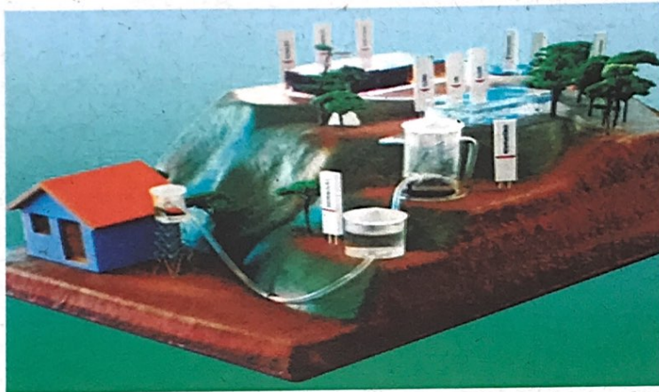
Figura 3 - Maquete Obtenção e Tratamento da água Dimensões : 2,0 m de comprimento x 1,0 m de largura .