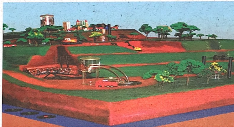
Figura 2 - Maquete Aterro Sanitário Dimensões : 1,8 m comprimento x 1,2 m de largura